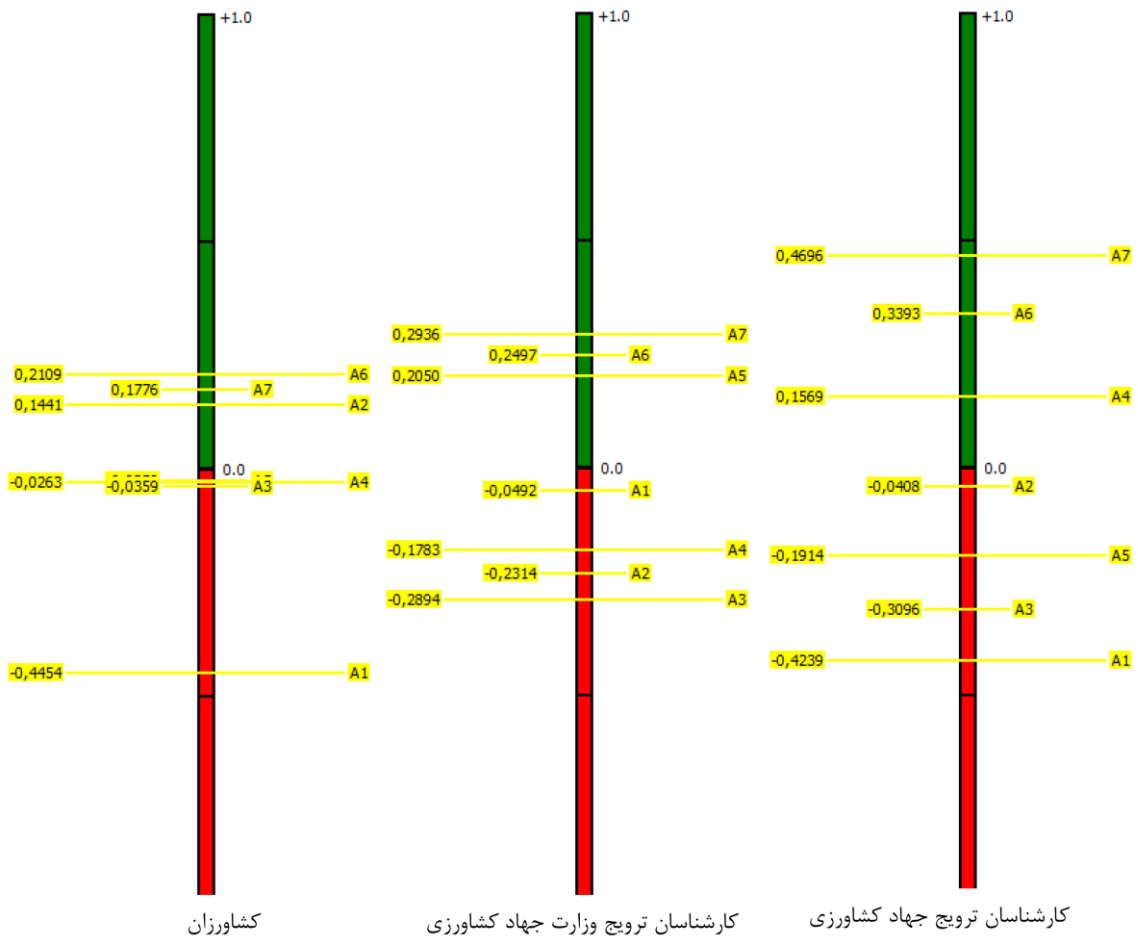
شکل ۱- نمودار رتبه بندی PROMETHEE II روش های فردی

۰/۲۸۹۴- و از نظر کارشناسان جهاد کشاورزی استفاده از ایمیل با جریان ۰/۴۲۳۹- نامناسب ترین روش آموزشی جهت برنامه ریزی سازگاری بوده است. افزون بر این لازم به یادآوری است که سایر روش های آموزشی ترویجی در شکل ۱ روی یک طیف از -۱ تا +۱ قرار گرفته اند و میزان اهمیت هر روش قابل مشاهده است.